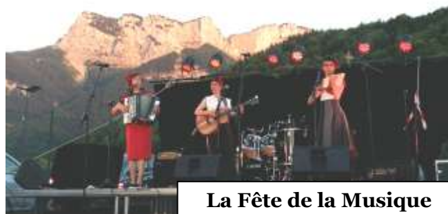
La Fête de la Musique