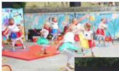
Spectacle des enfants de l'école