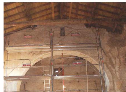
Le Couvent des Carmes, pendant la réalisation des travaux.

Ce couvent a été fondé en 1343 et détruit par trois fois au cours des dernières guerres. Joutant les vestiges du Château Delphinal, il sera ouvert au public. A visiter.